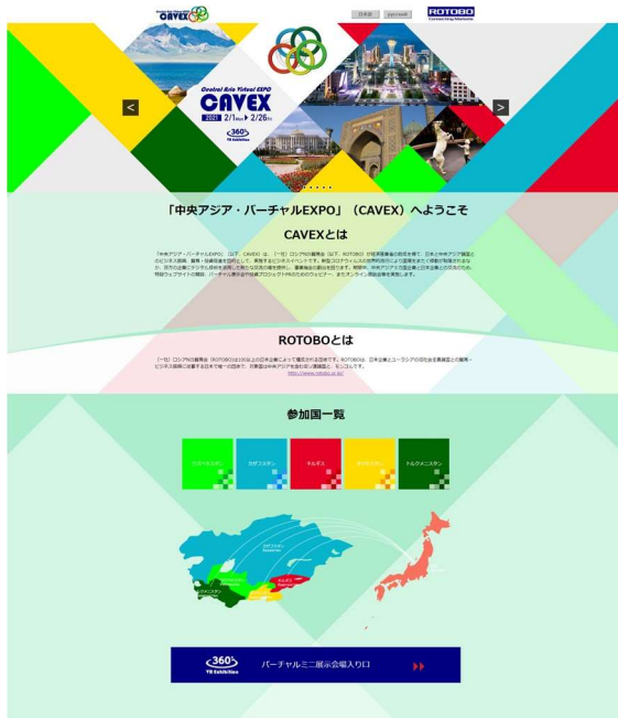
特設ウェブサイトトップページ

トップページでは、CAVEX事業の概要や参加国を紹介するとともに、バーチャルミニ展示会の入口を設置したり、投資ウェビナーの申し込みを受け付けたりして情報提供を実施した。また、国別ページを作成し、当該国についての基礎情報を紹介し、B2Bの候補となる各国の企業・組織・政府機関の情報を掲載し、ナショナルデイに開催される投資ウェビナーへの参加やB2B面談の希望を受け付けた。