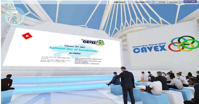
バーチャル展示会上に設置された特設ステージ(ナショナルデイ仕様のデザイン)