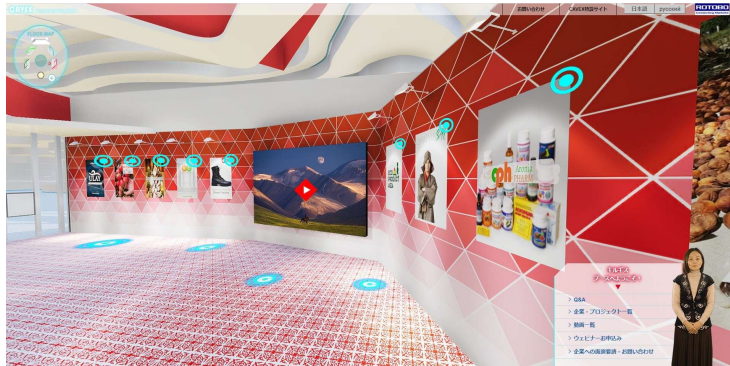
各国ブース内には企業紹介とスクリーンを設置