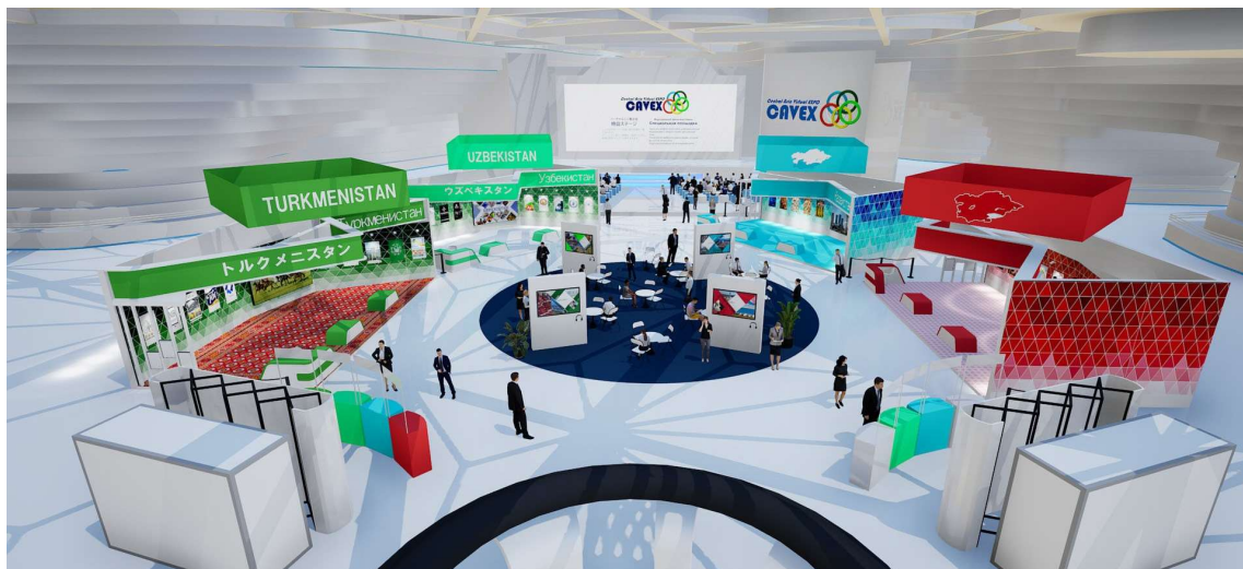
展示会場の全体図

CAVEXの特設ウェブサイトおよびバーチャルミニ展示会には各国の政府機関、組織、企業が参加し、日本企業に向けて商品や投資プロジェクトのPRを行った。以下にその概要をご紹介します。